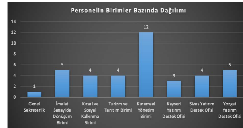
Personelin Birimler Bazında Dağılımı

Ajansımızın Genel Sekreterlik, SOP Bazlı Birimler, Kurumsal Yönetim Birimi ve Yatırım Destek Ofisleri olarak şekillenen teşkilat yapısında personelin birimlere göre dağılımı aşağıdaki tabloda gösterilmektedir.