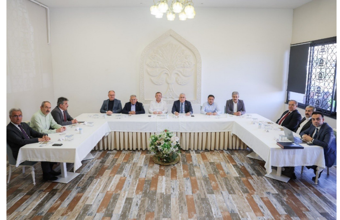
Orta Anadolu Kalkınma Ajansı Temmuz 2023 Yönetim Kurulu Toplantısı

Orta Anadolu Kalkınma Ajansı Yönetim Kurulu, 2023 yılında 5 (beş) adet toplantı gerçekleştirmiştir.