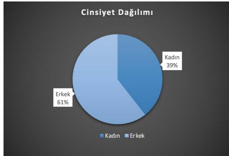
Ajans Personelinin Cinsiyet Dağılımı

Ajansımızda istihdam edilen personelin 15'i kadın, 23'ü erkek kişilerdir. Bu verilerin genel toplam personel sayısına oranı ise aşağıdaki tabloda gösterilmektedir.